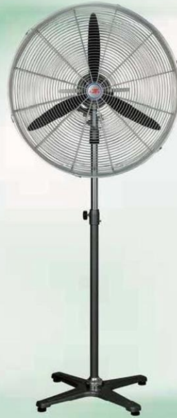
落地扇 Stand Fan (密网三叶塑胶座) FS-50E, FS-60E FS-65E, FS-75E