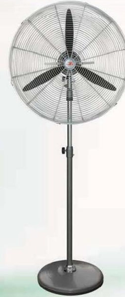
落地扇 Stand Fan (密网三叶生铁座) FS-50, FS-60, FS-65, FS-75