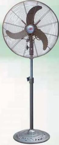
落地扇 Stand Fan (密网牛角叶花纹座) FS-45