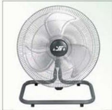
草地扇 Oscillating Floor Fan