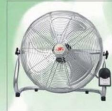
台地扇 Floor Fan