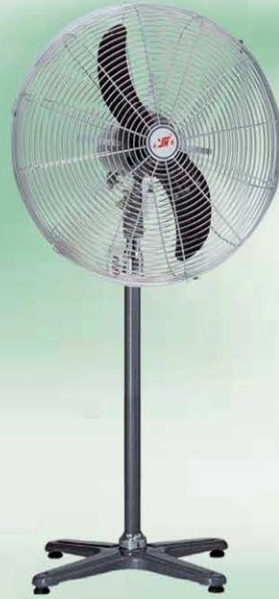
落地扇 Stand Fan (密网牛角叶十字座) FS-50, FS-60 FS-65