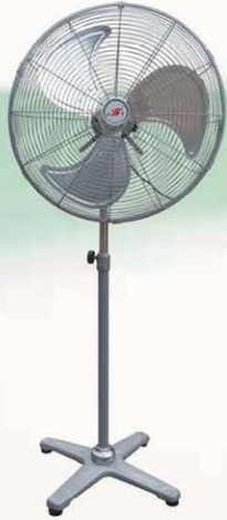
落地扇 Stand Fan (密网葵叶十字座) FS-40, FS-45 FS-50D