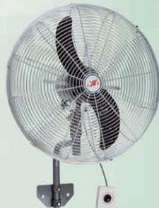
墙壁扇 Wall Fan (密网牛角叶外置调速) FB-50, FB-60 FB-65