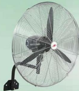
墙壁扇 Wall Fan (密网三叶) FB-50, FB-60 FB-65, FB-75