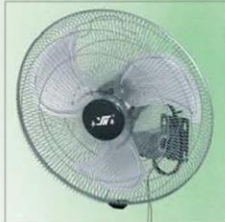
E型壁扇 Wall Fan