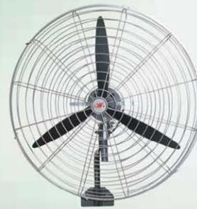
墙壁扇 Wall Fan (疏网三叶) FB-50, FB-60 FB-65, FB-75