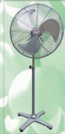
D型落地扇 Stand Fan