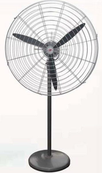
落地扇 Stand Fan (密网三叶生铁座) FS-50, FS-60 FS-65, FS-75