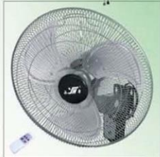
遥控壁扇 Remote Control Wall Fan