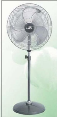
E型落地扇 Stand Fan