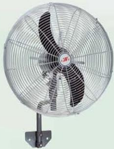
墙壁扇 Wall Fan (密网牛角叶) FB-50, FB-60 FB-65